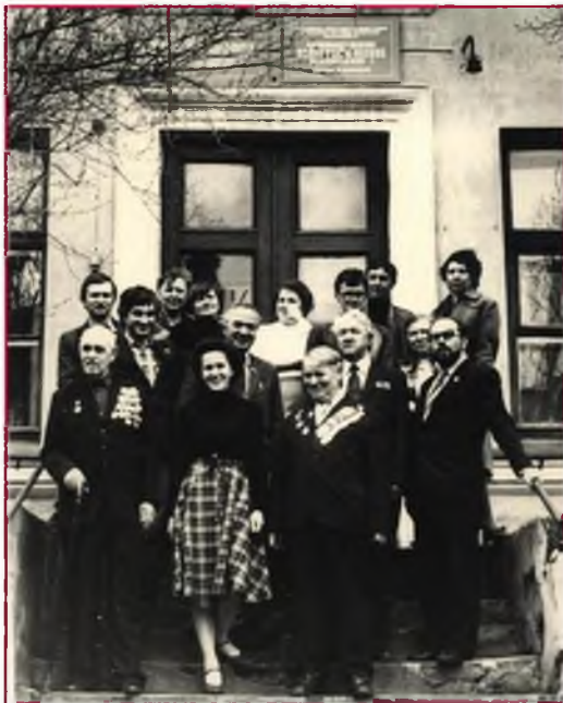
Коллектив редакции в середине 1980-х гг.

Представляем вашему вниманию рекомендательный список литературы по теме «Газета всех поколений. «Лужской правде» —100 лет». Данный буклет подготовлен к конференции «Лужская правда» вчера и сегодня. К 100-летию районной газеты», организованной Городской библиотекой Лужской ЦБС, редакцией газеты «Лужская правда» и Лужским обществом краеведов. В список включены публикации разных лет из фондов нашей библиотеки. При оформлении буклета использованы фотографии из архива редакции.