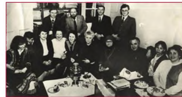
Коллектив «Лужской правды», 1980 –е гг.