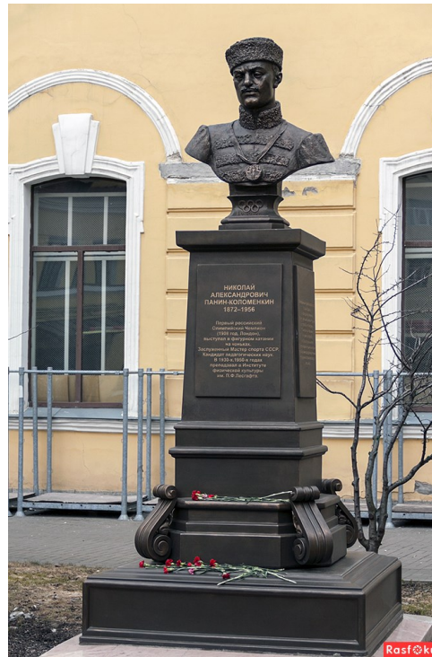
Памятник Н.А. Панину-Коломенкину на территории Национального государственного университета физической культуры, спорта и здоровья имени Лесгафта в Санкт-Петербурге

МКУК Лужская межпоселенческая районная библиотека Библиографический отдел