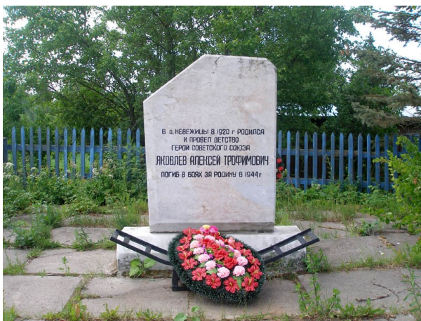
Памятный знак А.Т. Яковлеву в деревне Невежицы